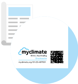
Label mit Trackingnummer