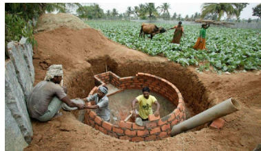
Indien Bau von Biogasanlagen