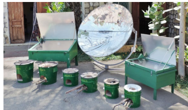
Madagaskar Solarkocher und effiziente Kocher