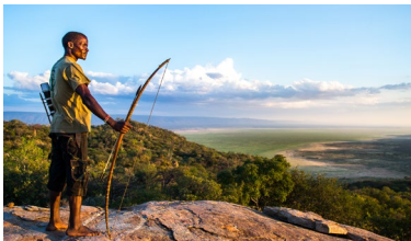
Tansania Schutz tansanischer Wälder