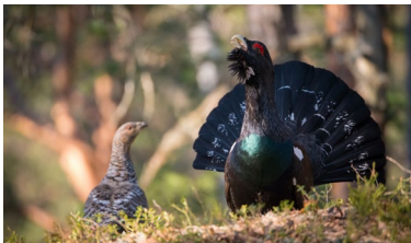
Schweiz Tier-, Natur- und Klimaschutz

Mit einem kleinen, auf Ihren Auftrag bezogenen Beitrag unter- stützen Sie hochwertige myclimate Klimaschutzprojekte.